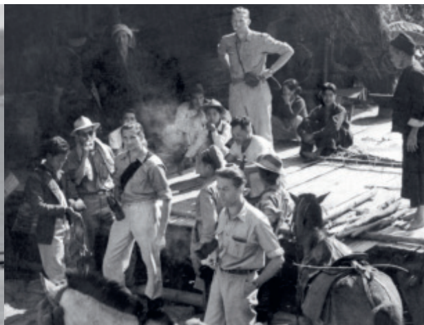
Elektroprojekt u Burmi