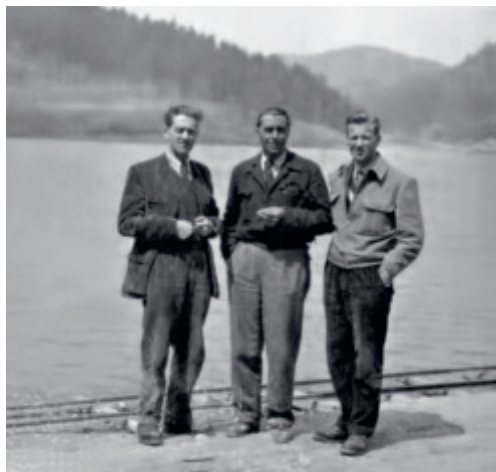
Izgradnja HE Vinodol

Rezultati rada stručnjaka Elektroprojekta čine jedinstvenu arhivu koja sadrži preko 23.000 knjiga projekata izrađenih u Elektroprojektu, među kojima se nalaze projekti većine hidroelektrana i termoelektrana te raznih drugih objekata izgrađenih u Republici Hrvatskoj. Područja djelatnosti koje su bila predmetom rada Elektroprojekta od njegovog osnutka do danas održavana su tijekom cijelog razdoblja postojanja te proširivana u skladu s prilikama i potrebama gospodarskog razvoja i zahtjevima na tržištu. Tako je, uz zaštitu voda, okoliša i prirode, predmet djelatnosti proširen i na korištenje poticanih obnovljivih izvora energije kao što su vjetar, sunce, biomasa i geotermalna energija, te i na infrastrukturne projekte kao što su tramvajska pruga i žičare.