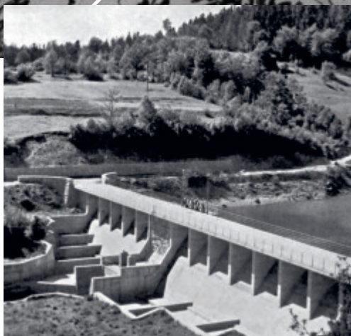
HE Vinodol – brana Bajer